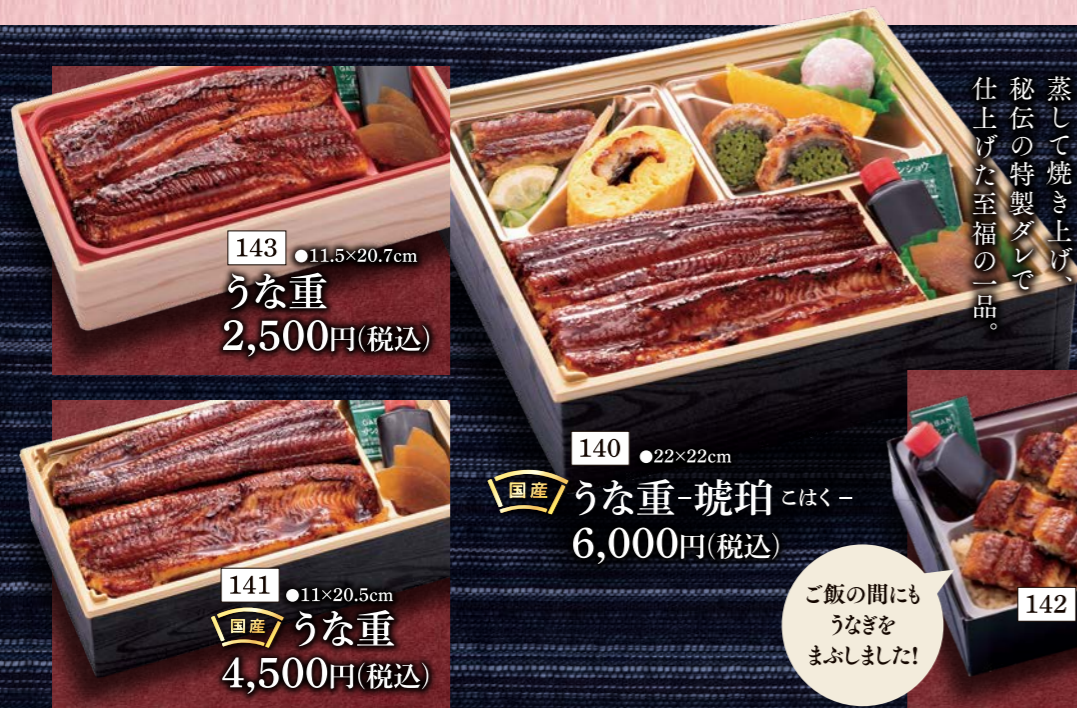
143 ●11.5×20.7cm うなぎ 2,500円(税込)

当店では、卵、乳、小麦、落花生、えび、そば、かに、いくら、キウイフルーツ、くるみ、大豆、カシューナッツ、バナナ、やまいも、もも、りんご、さば、ごま、さけ、いか、鶏肉、ゼラチン、豚肉、オレンジ、牛肉、あわび、まつたけを同じ調理場で使用しております。食物アレルギーがあるお客様は、お気軽にお申し出ください。