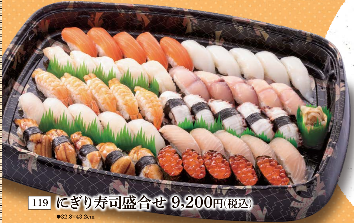
119 にぎり寿司盛合せ 9,200円(税込) ●32.8×43.2cm

打ち上げ、忘・新年会、歓送迎会、パーティーなど、 家や会社などシーンを問わずにご利用できます。 忙しい時間帯や夕方のご利用も大歓迎!!