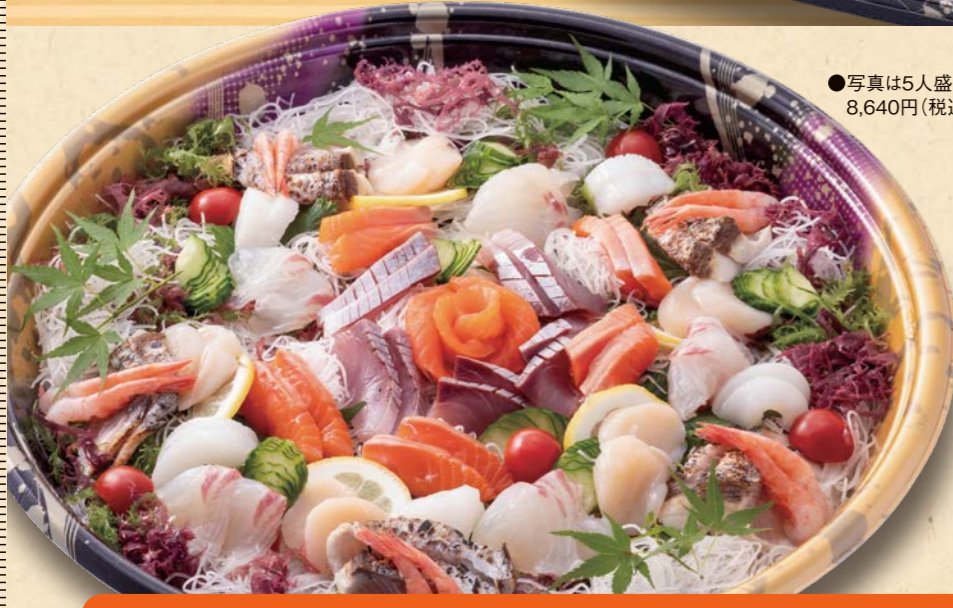
●写真は5人盛り 8,640円(税込)

ふじま水産 鮮度が自慢 お刺身 ふじま水産から 直送した新鮮な魚を 職人が捌き盛り付け お届けいたします。