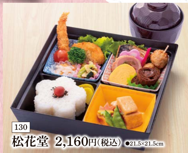
130 松花堂 2,160円(税込) ●21.5×21.5cm

当店では、卵、乳、小麦、落花生、えび、そば、かに、いくら、キウイフルーツ、くるみ、大豆、カシューナッツ、バナナ、やまいも、もも、りんご、さば、ごま、さけ、いか、鶏肉、ゼラチン、豚肉、オレンジ、牛肉、あわび、まつたけを同じ調理場で使用しております。食物アレルギーがあるお客様は、お気軽にお申し出ください。