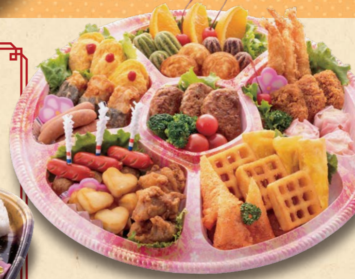
123 キッズ用オードブル ●直径40cm 6,480円(税込)

当店で、卵、乳、小麦、落花生、えび、そば、かに、いくら、キウイフルーツ、くるみ、大豆、カシューナッツ、バナナ、やまいも、もも、りんご、さば、ごま、さけ、いか、鶏肉、ゼラチン、豚肉、オレンジ、牛肉、あわび、まつたけを同じ調理場で使用しております。食物アレルギーがあるお客様は、お気軽にお申し出ください。