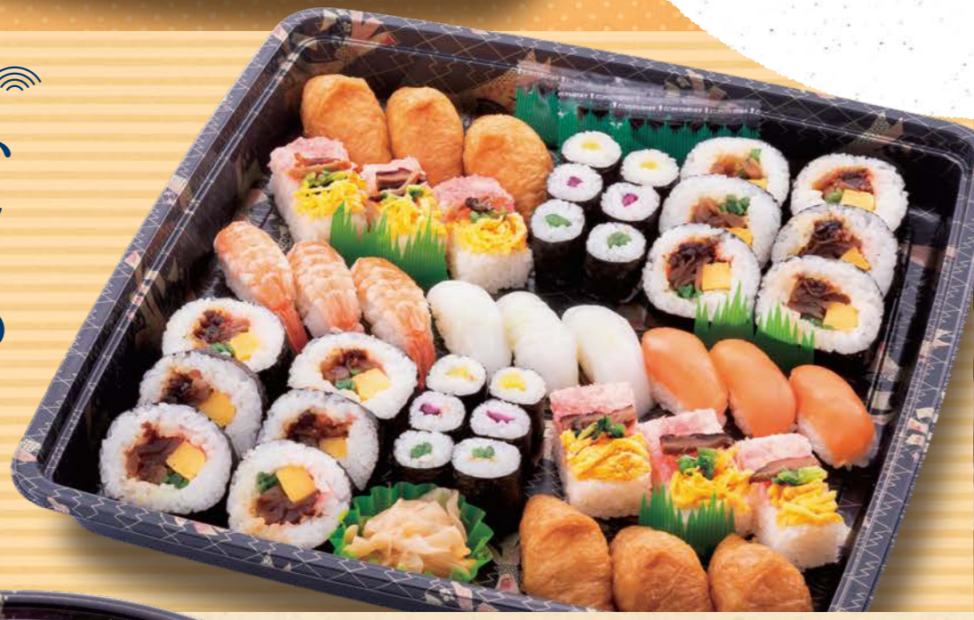
122 寿司盛合せ ●36×36cm 5,400円(税込)

ふじまの 寿司 ネタ、シャリ、酢にこだわり 職人が一貫貫、酢にこだわり 丁寧に握り盛り付けます。