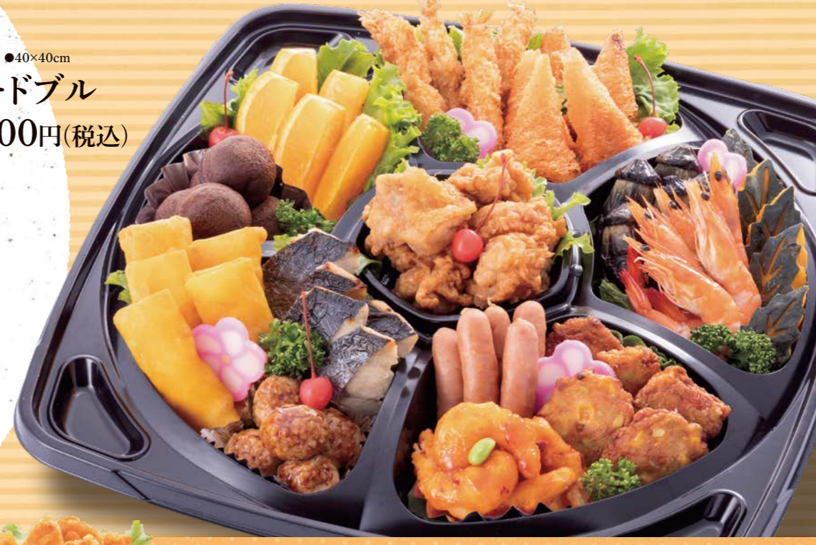
118 ●40×40cm オードブル 8,800円(税込)

ふじまの 寿司 ネタ、シャリ、酢にこだわり 職人が一貫貫、酢にこだわり 丁寧に握り盛り付けます。