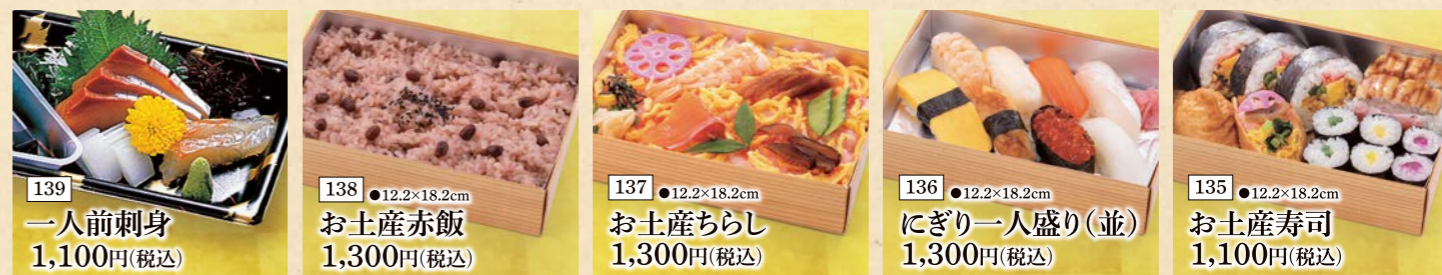
139 一人前刺身 1,100円(税込) 138 ●12.2×18.2cm お土産赤飯 1,300円(税込) 137 ●12.2×18.2cm お土産ちらし 1,300円(税込) 136 ●12.2×18.2cm にぎり一人盛り(並) 1,300円(税込) 135 ●12.2×18.2cm お土産寿司 1,100円(税込)

— お好みの組合せで選ぶ単品料理。ちょっとプラスしたい時や、おみやげなどにもおすすめです。 —