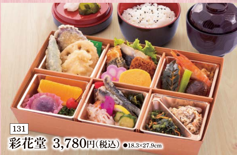
131 彩花堂 3,780円(税込) ●18.3×27.9cm