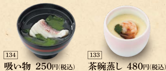
134 吸い物 250円(税込) 133 茶碗蒸し 480円(税込)